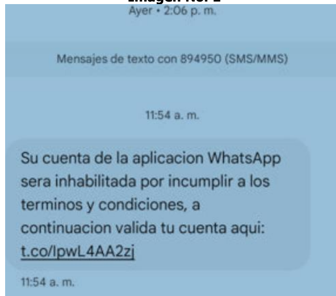
Imagen No. 1

El 31 de julio de 2025, la Comisión de Regulación de Comunicaciones (en adelante, CRC ) recibió una comunicación radicada bajo el número 2025814506, en la cual COLOMBIA MÓVIL S.A. E.S.P. ( COLOMBIA MÓVIL ) informó sobre un presunto uso indebido del código corto 894950 , afirmando que recibió reportes de sus usuarios de telefonía móvil en los cuales se denunciaban presuntos ataques bajo las modalidades smishing y phishing vía mensajes de texto (SMS). Así mismo, señaló que el asignatario es la sociedad SPECTER LINE S.A.S. , proveedor de contenidos y aplicaciones (PCA), con contrato de acceso vigente con COLOMBIA MÓVIL . Para soportar sus afirmaciones, esa compañía aportó como prueba, entre otros documentos, la siguiente imagen en la que se observan los SMS remitidos a través del código corto mencionado: