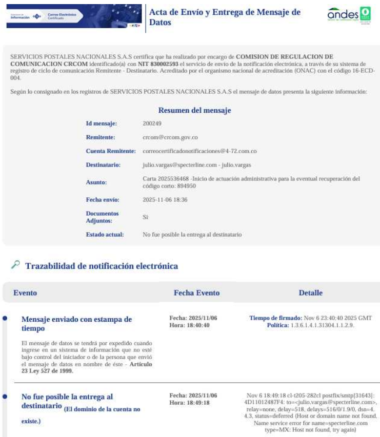
Imagen 1 Acta de envío y entrega de mensajes de datos

Dicha actuación administrativa fue enviada por la CRC a SPECTER a los correos electrónicos: julio.vargas@specterline.com; legal@specterline.com; y info@specterline.com, y a la dirección de correspondencia Km 2 Vía Chia Cajicá Ed Quantum Of 207 Chía, Cundinamarca, de acuerdo con la información registrada en el certificado de existencia y representación de SPECTER , identificada con el NIT. 901.342.734 - 3, así como en el registro de esa sociedad ante la CRC . No obstante, la comunicación con el inicio de actuación administrativa para la recuperación del código corto no pudo ser entregada debido a que los correos electrónicos registrados no existen y en la dirección de correspondencia no fue recibida, tal y como se observa en las siguientes imágenes 2 .