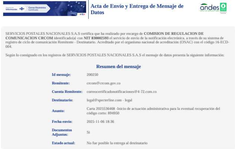
Imagen 2 Acta de envío y entrega de mensajes de datos