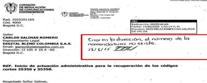
Imagen No. 1

Dicha actuación administrativa fue enviada para su notificación a la dirección registrada por DIGITAL BLEND en su certificado de existencia y representación (Calle 105#18A -60 en la ciudad de Bogotá), sin embargo, la misma no pudo ser entregada debido a que la dirección registrada no existe.