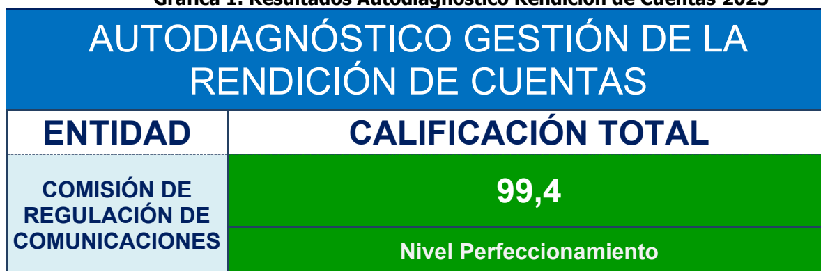
Gráfica 1. Resultados Autodiagnóstico Rendición de Cuentas 2025

El Autodiagnóstico de Rendición de Cuentas del Departamento Administrativo de la Función Pública (DAFP) aplicado para la vigencia 2025 constituye uno de los principales insumos para orientar el diseño de la Estrategia de Rendición de Cuentas 2026. Los resultados obtenidos muestran que la Comisión de Regulación de Comunicaciones mantiene un alto nivel de madurez institucional , situándose nuevamente en el nivel de perfeccionamiento , lo que refleja consistencia y estabilidad en la gestión de la transparencia, el acceso a la información y la relación con los grupos de valor.