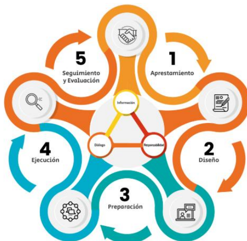
Gráfica 2. Etapas Estrategia de Rendición de Cuentas