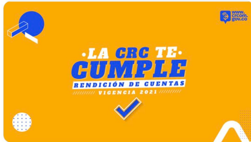
Paola A. Bonilla y 7 más

CRC Colombia @CRCCol · 20 oct. ... Iniciamos nuestra rendición de cuentas vigencia 2021 #CRCTeCumple , para seguirla en directo ingresa a nuestro canal de Youtube youtube.com/watch?v=kj24ou... o en Facebook fb.me/e/5IVIdttuv