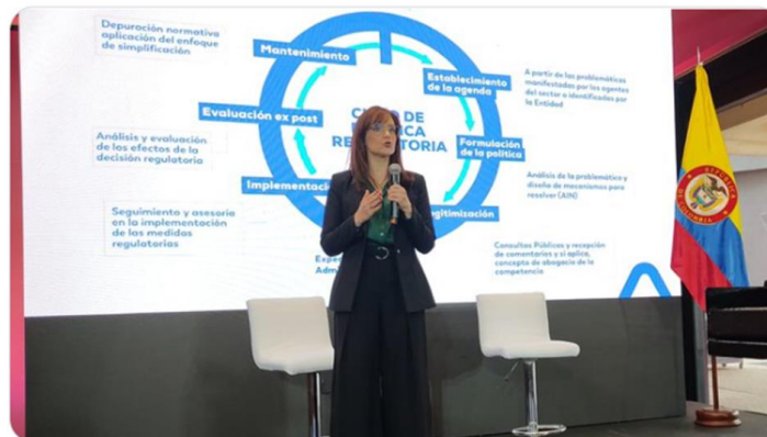
Tú y 4 más

CRC Colombia @CRCCol · 20 oct. ... #AEstaHora en #CRCTeCumple presentamos los resultados del trabajo para la ejecución de la Agenda Regulatoria de nuestra entidad para la vigencia 2021 - 2022. Síguela en directo a través de youtube.com/watch?v=kj24ou... o fb.me/e/5IVIdttuv