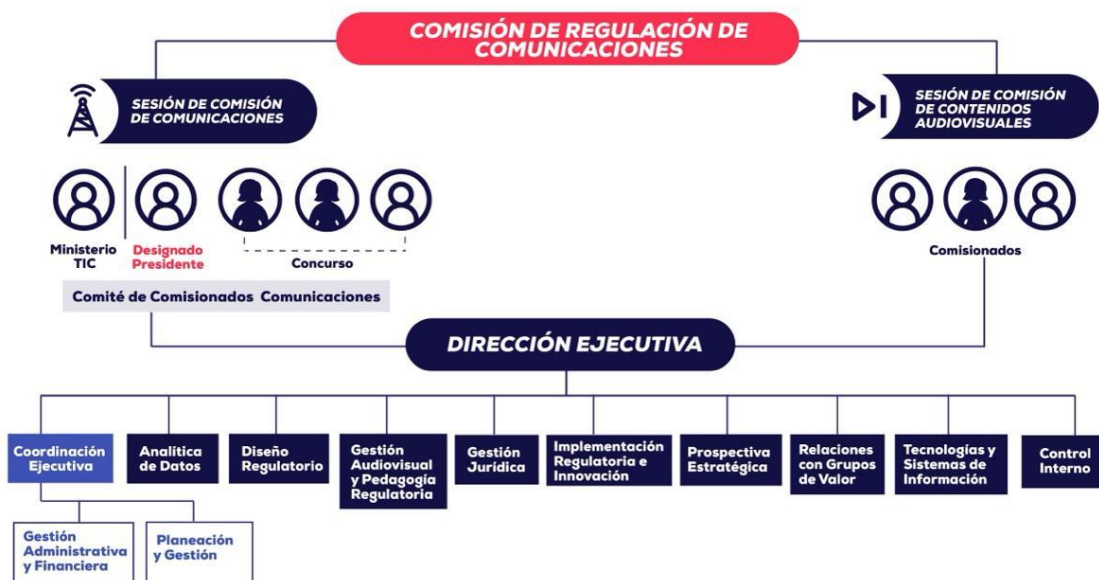
Ilustración 1. Estructura de la CRC