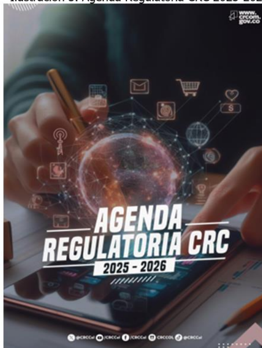
Ilustración 3. Agenda Regulatoria CRC 2025-2026

En línea con la política de mejora regulatoria de la Comisión, la Agenda Regulatoria CRC 2025-2026 es el punto de partida dentro del ciclo regulatorio, que responde a criterios de transparencia y objetividad en la identificación de tendencias, análisis de disponibilidad de recursos y priorización de actividades e interacción permanente con los grupos de valor. Así, su construcción se realiza a partir de: