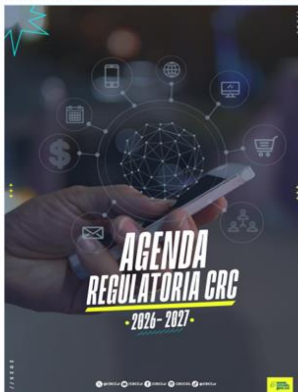
Ilustración 3. Agenda Regulatoria CRC 2026-2027

La Agenda Regulatoria es una de las herramientas con las que cuenta la Entidad para la planificación sectorial a mediano plazo y, dado su carácter participativo y de transparencia, se constituye en uno de los pilares fundamentales de la mejora regulatoria. Los proyectos y actividades indicados están encaminados a los principales temas identificados para contribuir al