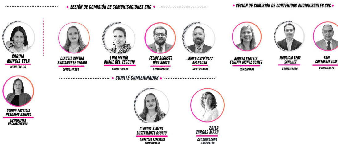
Ilustración 1. Estructura de la CRC