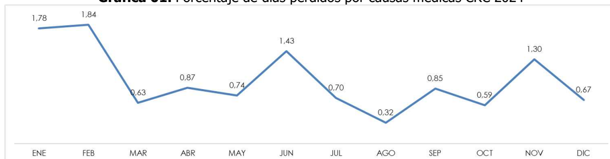
Gráfica 01. Porcentaje de días perdidos por causas médicas CRC 2024

La principal causa de ausentismo en el 2024 estuvo relacionada con afectaciones del sistema respiratorio (25 casos), por las afectaciones infecciosas (23 casos), también se presentaron eventos del sistema osteomuscular (7 casos).