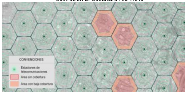
Ilustración 2. Cobertura red móvil