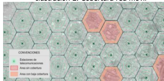
Ilustración 2. Cobertura red móvil

Los servicios de voz y datos ofrecidos por los operadores móviles en Colombia tanto para tecnologías 3G UMTS y 4G LTE, técnicamente implican que el rango efectivo de funcionamiento de cada estación es reducido, lo que implica una limitada cobertura a usuarios, haciendo que la exigencia de requisitos adicionales tenga la potencialidad de impedir la ubicación de infraestructura de telecomunicaciones requerida en el municipio. Una restricción de despliegue de nueva infraestructura de telecomunicaciones tiene como consecuencia sectores poblados sin cobertura alguna de servicios de telecomunicaciones, o con condiciones deficientes de calidad y cobertura que afectarán a los usuarios actuales y potenciales de dichos servicios, tal como se presenta en la Ilustración 2.