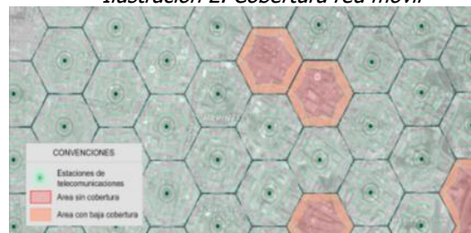
Ilustración 2. Cobertura red móvil

Los servicios de voz y datos ofrecidos por los operadores móviles en Colombia tanto para tecnologías 3G UMTS y 4G LTE, técnicamente implican que el rango efectivo de funcionamiento de cada estación es reducido, lo que implica una limitada cobertura a usuarios, haciendo que la exigencia de requisitos adicionales tenga la potencialidad de impedir la ubicación de infraestructura de telecomunicaciones requerida en el municipio. Una restricción de despliegue de nueva infraestructura de telecomunicaciones tiene como consecuencia sectores poblados sin cobertura alguna de servicios de telecomunicaciones, o con condiciones deficientes de calidad y cobertura que afectarán a los usuarios actuales y potenciales de dichos servicios, tal como se presenta en la Ilustración 2.