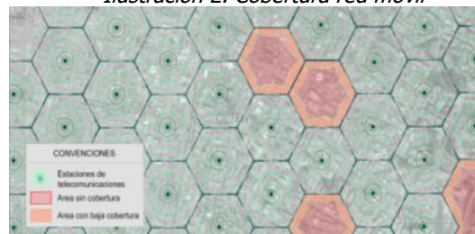
Ilustración 2. Cobertura red móvil

Los servicios de voz y datos ofrecidos por los operadores móviles en Colombia tanto para tecnologías 3G UMTS y 4G LTE, técnicamente implican que el rango efectivo de funcionamiento de cada estación es reducido, lo que implica una limitada cobertura a usuarios, haciendo que la exigencia de requisitos adicionales tenga la potencialidad de impedir la ubicación de infraestructura de telecomunicaciones requerida en el municipio. Una restricción de despliegue de nueva infraestructura de telecomunicaciones tiene como consecuencia sectores poblados sin cobertura alguna de servicios de telecomunicaciones, o con condiciones deficientes de calidad y cobertura que afectarán a los usuarios actuales y potenciales de dichos servicios, tal como se presenta en la Ilustración 2.