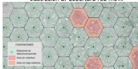
Ilustración 2. Cobertura red móvil

Los servicios de voz y datos ofrecidos por los operadores móviles en Colombia tanto para tecnologías 3G UMTS y 4G LTE, técnicamente implican que el rango efectivo de funcionamiento de cada estación es reducido, lo que implica una limitada cobertura a usuarios, haciendo que la exigencia de requisitos adicionales tenga la potencialidad de impedir la ubicación de infraestructura de telecomunicaciones requerida en el municipio. Una restricción de despliegue de nueva infraestructura de telecomunicaciones tiene como consecuencia sectores poblados sin cobertura alguna de servicios de telecomunicaciones, o con condiciones deficientes de calidad y cobertura que afectarán a los usuarios actuales y potenciales de dichos servicios, tal como se presenta en la Ilustración 2.