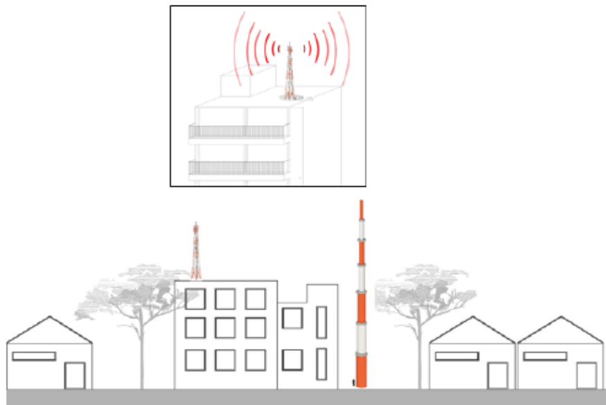
Ilustración 3. Estructura en azotea y torre auto soportada

Ahora bien, el área de servicio depende de la ubicación de la antena y de la altura de esta respecto a las edificaciones circunvecinas, es por esto que las antenas de telecomunicaciones se instalan en infraestructura soporte como torres o mástiles o en ubicaciones altas (azoteas, terrazas) donde se supere la altura de las edificaciones aledañas. En la Ilustración 3, se puede observar cómo estructuras de soporte (para el ejemplo que nos ocupa una estructura en azotea y una torre auto soportada) de comunicaciones inalámbricas, requieren una mayor altura que las edificaciones circunvecinas para poder asegurar la prestación eficiente de los servicios que son ofrecidos a través de las antenas que se instalan en dicha infraestructura.