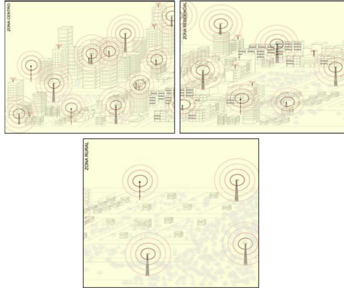
Ilustración 1. Despliegue y cobertura red móvil por densidad poblacional