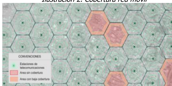
Ilustración 2. Cobertura red móvil

Los servicios de voz y datos ofrecidos por los operadores móviles en Colombia tanto para tecnologías 3G UMTS y 4G LTE, técnicamente implican que el rango efectivo de funcionamiento de cada estación es reducido, lo que implica una limitada cobertura a usuarios, haciendo improcedente la prohibición de ubicación en diferentes zonas en inmuebles del municipio. La restricción de despliegue de infraestructura de telecomunicaciones tiene como consecuencia sectores poblados sin cobertura alguna de servicios de telecomunicaciones, o con condiciones deficientes de calidad y cobertura que afectarán a los usuarios actuales y potenciales de dichos servicios, tal como se presenta en la Ilustración 2. Cobertura móvil.