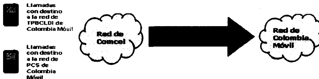
Gráfico 2. Curso de la llamada originada en la red de COMCEL según el tipo de numeración utilizada

A continuación se analizará el detalle en cada caso, a efectos de aclarar la manera cómo deben remunerarse las redes de acuerdo con lo antes expuesto, teniendo en cuenta, en todo caso, que el tráfico que se genera en los eventos i) y ii) antes enunciados, siempre será entregado a COLOMBIA MÓVIL a través de los enlaces unidireccionales de COMCEL , toda vez que en ambos