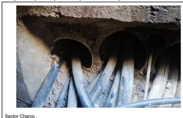
Imagen 1. Fotografía y descripción aportadas por UNIMOS para la cámara ubicada en el Sector Charco.

Fuente. Página 17 del radicado 2022803017.