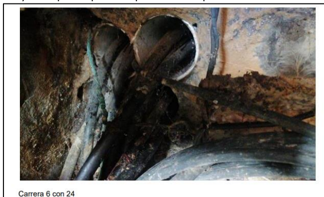
Imagen 2. Fotografía y descripción aportadas por UNIMOS para la cámara ubicada en la Carrera 6 con 24.

Fuente. Página 15 del radicado 2022803017.