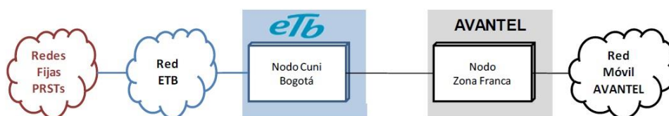
Gráfica No. 1