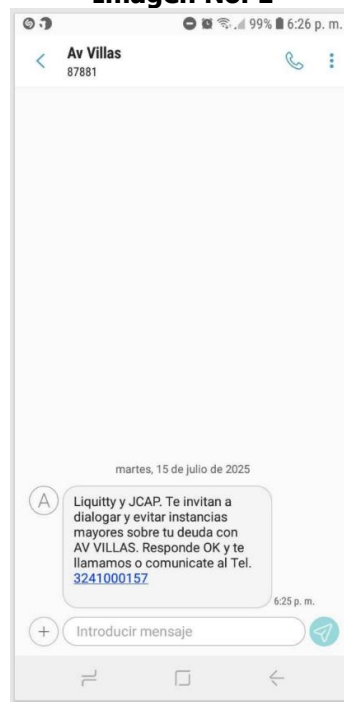
Imagen No. 1

El 15 de julio de 2025, la CRC recibió una comunicación radicada bajo el número 2025815792, por medio de la cual un usuario de servicios de telecomunicaciones móviles informó sobre un presunto uso indebido del código corto 87881 . Al respecto, aportó como prueba la siguiente captura de pantalla: