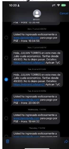
Imagen No. 3