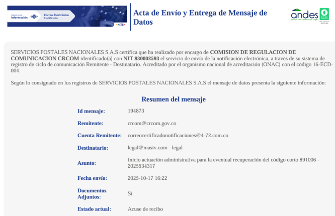
Imagen No. 2

El inicio de la mencionada actuación administrativa fue comunicado a ELIBOM el 17 de octubre de 2025 mediante correo electrónico, tal y como consta en el Acta de Envío y Entrega de Mensaje de Datos expedido por SERVICIOS POSTALES NACIONALES .