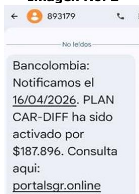
Imagen No. 2