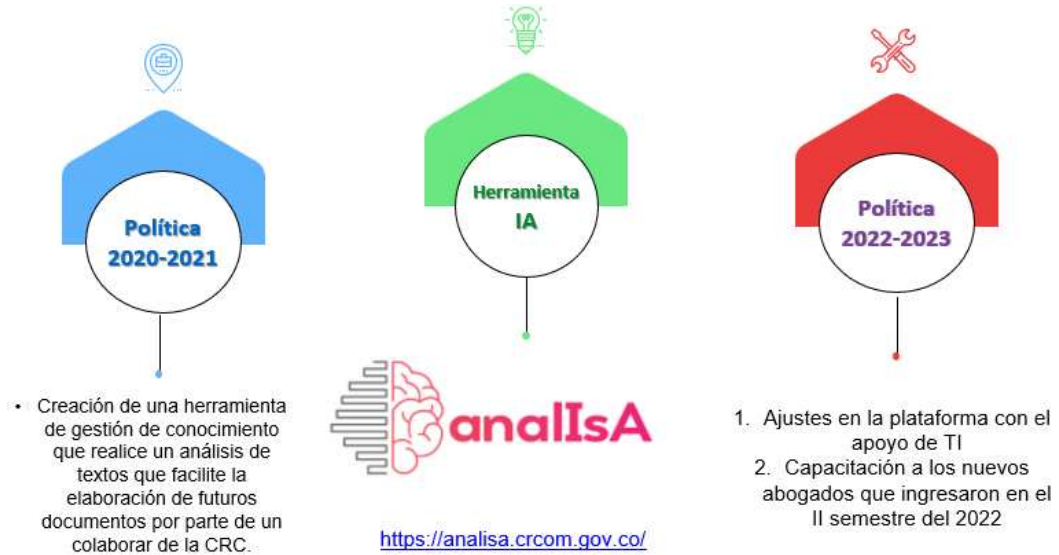
Gráfica 1. Herramienta IA