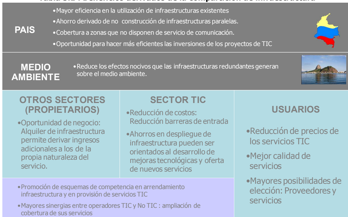
Tabla 3.1 : Beneficios derivados de la compartición de infraestructura

Fuente: Elaboración propia con base en CONCOL (2011) y conclusiones del V Taller Internacional de Regulación: Compartición de Infraestructura para el despliegue de las TIC, Estrategias y Oportunidades